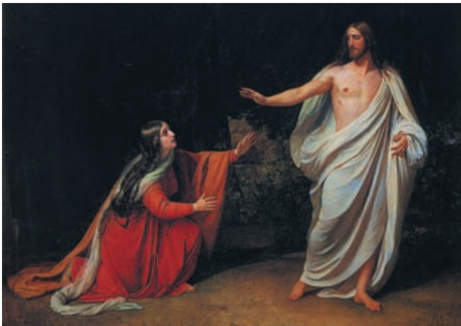
Репродукция. А. А. Иванов. Явление Христа Марии Магдалине после воскресения. 1835

разно славному Телу Его» (Флп. 3:20, 21). Так же, как воскресший были на земле.