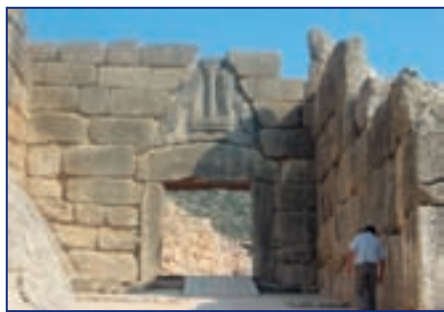
Монументальные Львиные ворота и циклопические стены древних Микен

За воротами находится так называемый могильный круг, огораживающий царские могилы, кото-