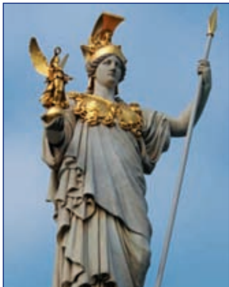
Скульптура богини Афины

вое тело царя Леонида по приказу Ксеркса I обезглавили, а голову насадили на кол.