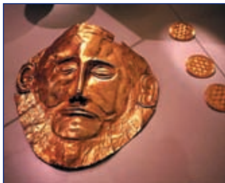
Золотая маска, найденная в царских могилах