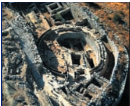
Могильный круг, огораживающий царские захоронения

После падения Микен вопрос, какой город станет столицей Греции, оставался открытым вплоть до VI века до н.э. Тем временем постепенно укреплялись Афины, став со временем центром политической, культурной и религиозной жизни Греции. Верхняя часть города изначально служила крепостью. Крутые склоны горы позволяли защитникам крепости успешно обороняться от врагов. Позже на афинском Акрополе построили храм богини войны и победы Афины, в честь которой и был назван город. Храм украшала огромная скульптура Афины из слоновой кости и золота.