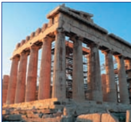
Парфенон, храм богини Афины

По иронии судьбы исход войны был решен не на суше, а на море. Греческий военный флот, укрывавшийся возле острова Саламин, был атакован флотилией персов. 1400 отлично оснащенных персидских кораблей выступили против 360 греческих кораблей. Но благодаря великолепному маневрированию и исключительному мужеству греки потопили сотни персидских кораблей, после чего противник вынужден был отступить.