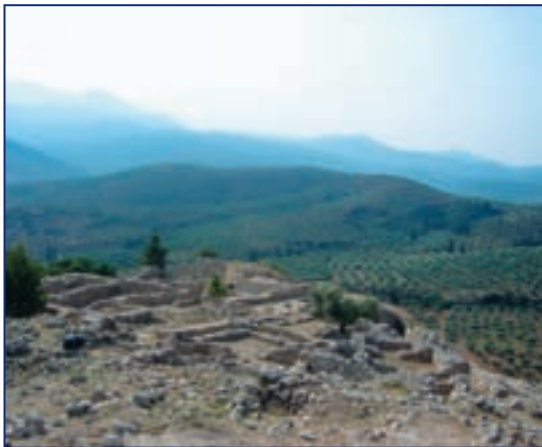
Развалины древних Микен

Древние греки были выдающимся народом, оказавшим огромное влияние на ход мировой истории. После того, как распалась империя Александра Македонского, греческий язык остался языком международного общения на многие столетия, а греческая философия формировала мышление людей в последующие периоды цивилизации. Европейские языки, в том числе и русский, позаимствовали из древнегреческого языка множество слов. К примеру, слово алфавит произошло от слияния двух первых букв греческого алфавита – альфа и бета. Первые поселенцы на территории Греции, по-видимому, пришли из Месопотамии. Более поздние поселенцы имели индоевропейское происхождение, из северной части материка. Таким образом, в древнегреческом этносе слились две народности, они и сформировали высокоразвитую