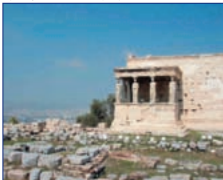
Руины древних Афин

Согласно верованиям греков, посредниками между людьми и невидимым миром богов были оракулы, или прорицатели, кото-