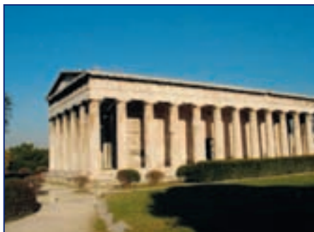
Этот древнегреческий храм сохранился лучше всех

Греческая концепция существования человека после смерти также была неопределенной и разно-