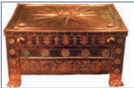
Золотая урна из гробницы Филиппа II

планам не суждено было сбыться. Александр умер от внезапно поразившей его болезни в 32-летнем возрасте, находясь в зените своей славы, когда почти весь мир лежал у его ног. После смерти Александра созданную им огромную империю поделили между со-