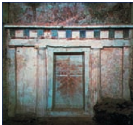
Фасад гробницы Филиппа II

войскам Дария III при реке Граникус 1 . На реке Пинар у города Исс 2 состоялась вторая битва греков с персидским войском. Александр снова разгромил персов, а Дарий III позорно бежал с поля боя.