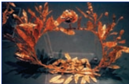
Золотой лавровый венок из гробницы Филиппа II

Несмотря на развитую культуру и философскую мысль, у греков было на удивление смутное представление об истинном Боге. Греческий эпос с мифами об Олимпийских богах и земных героях привел к политеизму – верованию