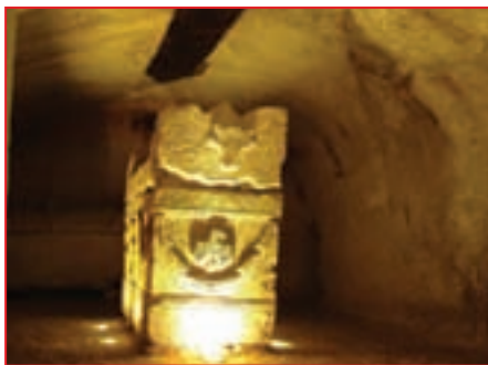
Саркофаги в катакомбах Бет-Шеарим

Город был разрушен римским императором Галлом во время подавления еврейского восстания 352 года. Меньше всего пострадал некрополь, обитель мертвых не повредили даже землетрясения. А пещера саркофагов считается