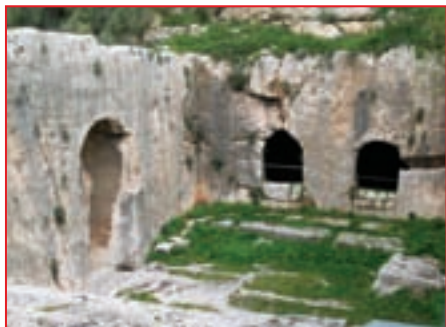
Гробница Адиабенских Царей

Ирода, и «царские гробницы», высеченные в скале к северу от Иерусалима. Самые древние из них датируются 60 г. н.э.