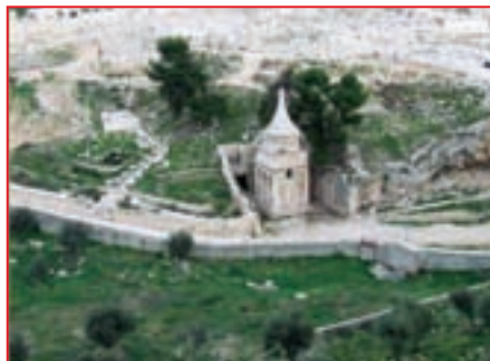
Гробница в Кедронской долине

вестняковых скалах. Погребальные пещеры состояли из нескольких камер, соединенных коридорами. Вход в пещеру закрывал большой круглый камень. В Иерусалиме есть «Сад Гроба Господня», в нем вам покажут погребальный склеп, который считается могилой Иисуса Христа. Есть мнение, что в саду хоронили еще во времена железного века, за сотни лет до Христа, и что эта могила была переделана для вторичного захоронения в византийский период.