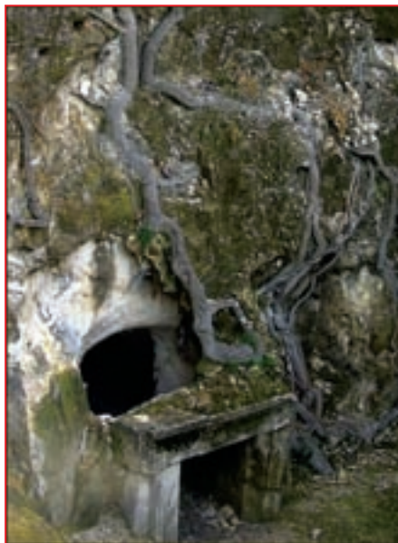
Раскопки города Бет-Шеарим

Среди обнаруженных пещер одна – самая просторная и наиболее почитаемая. Именно здесь находится могила рабби Иехуды ха-Наси, которая является местом поклонения, а также захоронения членов его семьи. Вход в пещеру закрыт тремя каменными дверями, украшенными арками. Благодаря мо-