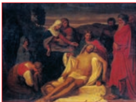
Репродукция. Карл Венцел. Положение во гроб. 1859

После Своего воскресения Иисус Христос неоднократно являлся Своим ученикам и многим другим людям. А много лет спустя Иисус Христос явился Своему ученику Иоанну на острове