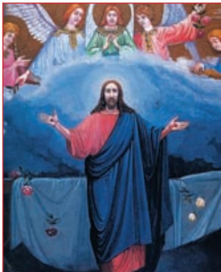
Репродукция. Михаил Соловьев. Воскресение. 1884