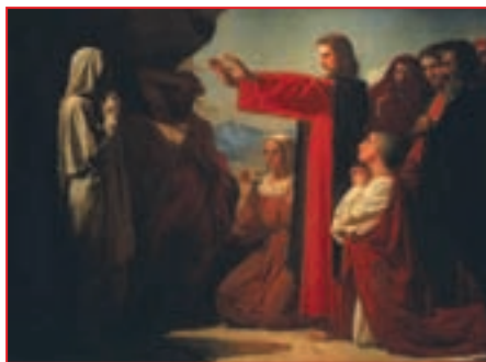
Репродукция. Леон Бонна. Воскрешение Лазаря

Мы видим, что Иисус говорит о смерти, как о сне. Неужели это одно и то же? Никто не испытывает обеспокоенности, каждый вечер отправляясь спать в свою комнату. Никто из нас не огорчается, увидев спящего человека, потому что знаем,