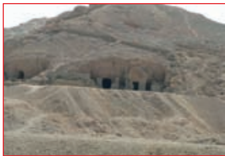
Долина царских гробниц

дя. Большинство погребальных лодок имели небольшой размер. Но фараон Хеопс, который отличался глобальным мышлением, заказал себе целую флотилию. В его похоронной процессии участвовали 6 огромных лодок. В Гизе, к востоку от пирамиды Хеопса, можно увидеть три углубления в форме лодки. Именно там стояли ладьи фараона. Самих лодок там давным-давно нет. По всей видимости, местные жители использовали деревянные части в качестве дров. В 1954 году к югу от пирамиды Хеопса археологи обнаружили еще два подобных углубления. Там были найдены разобранные погребальные ладьи, деревянные детали которых были связаны веревками. В одном из углублений обнаружена 651 деталь ладьи. Несколько лет ученые потратили на