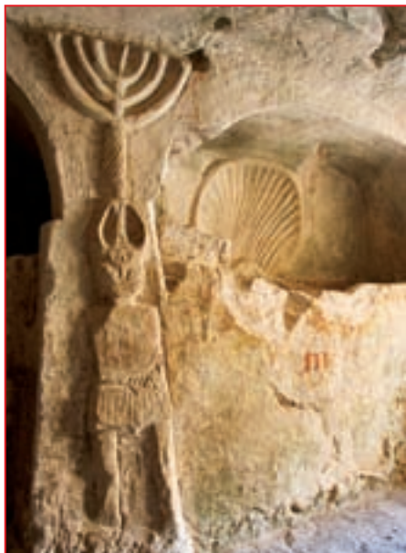
Изображения Меноры в подземных коридорах Бет-Шеарим