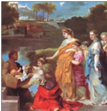
Репродукция. Себастьян Бурдон. Обретение Моисея. Фрагмент. 1650

Отметим, однако, тот факт, что в написанных Моисеем библейских книгах мы нигде не находим описания магических методов врачевания, о которых