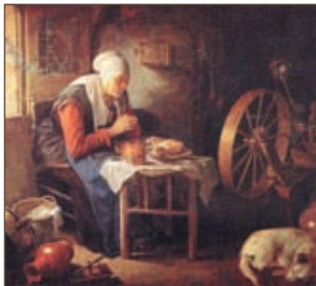
Репродукция. Дюу Геррит. Молитва пряжи перед обедом. Фрагмент

Хорошее здоровье – это не только результат нашего отказа от того или иного вида мяса или рыбы. Кроме этого, мы должны находить время для физических упражнений и полноценного