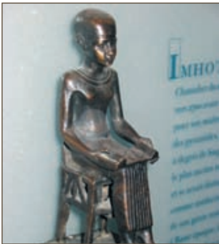
Статуэтка Имхотепа. Бронза. VII в. до н.э. Париж, Лувр

Самое древнее упоминание о медицинских папирусах периода Древнего царства найдено на стене гробницы Уаш-Птаха – главного архитектора царя 5-й династии Неферирика-Ра (XXV в. до н.э.). Жрец и историк Манефон сообщает о том, что второй царь