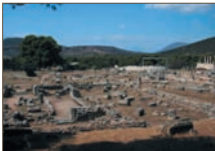
Эпидавр. Руины храма Асклепия.

О медицине эпохи эллинизма повествуют медицинские трактаты ученых