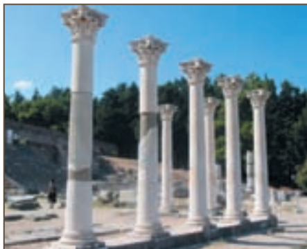
Асклепион на острове Кос

О медицине классического периода истории Греции дает представление “Гиппократов сборник” – выдающийся памятник медицинской литературы, составленный около III в. до н. э. из сочинений древнегреческих врачей. Он назван именем великого врача ан-