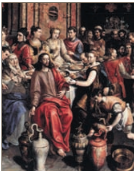
Репродукция. Мартин де Вос. Брак в Канне. Фрагмент. 1596–97

Одной из наиболее распространенных традиций, которая осуждается в Библии, является употребление алкогольных напитков. Некоторые люди полагают, что Иисус Христос одобрительно относился к употреблению алкоголя. Они ссылаются на эпизоды, когда Иисус превратил воду в вино на свадебном пире и когда во время пасхальной вечери подал ученикам чашу с вином «от плода виноградного» (Мк. 14:25).