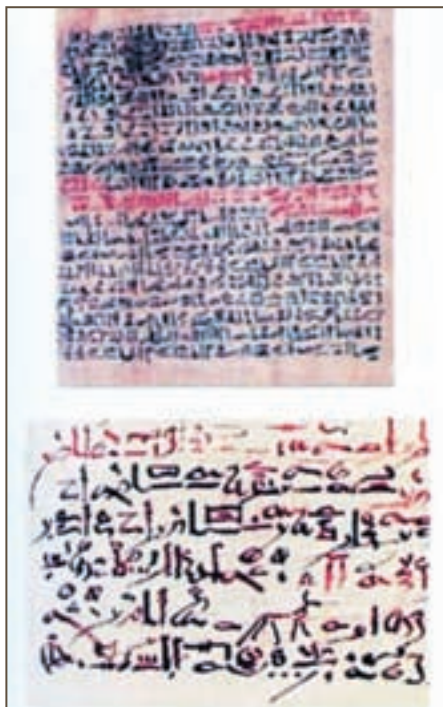
Фрагменты папируса Эдвина Смита