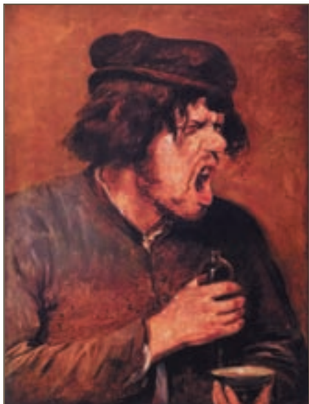
Репродукция. Браувер Адриан. Пьяница. 1630—1640

Некоторые люди утверждают, что употребление алкогольных напитков в умеренных количествах не приносит вреда и даже полезно. Однако никто не может быть уверенным в том, что уберется от тяжелой алкогольной зависимости, в которую попали многие из тех, кто начинал с той самой «малой дозы». Многие выпивают «за компанию» или по случаю праздника. К сожалению, множество людей, идущих таким путем, становятся безнадежными алкоголиками. Библия указывает нам, что в отношении к алкоголю необходимо придерживаться полного воздержания.