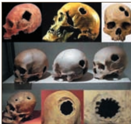
В древних захоронениях было обнаружено огромное количество черепов со следами трепанации

Сегодня найдены остатки древних египетских лечебниц. Фрагменты подобных здравниц сохранились и в Греции. Здесь они назывались асклепионами (в честь бога врачевания Асклепия).