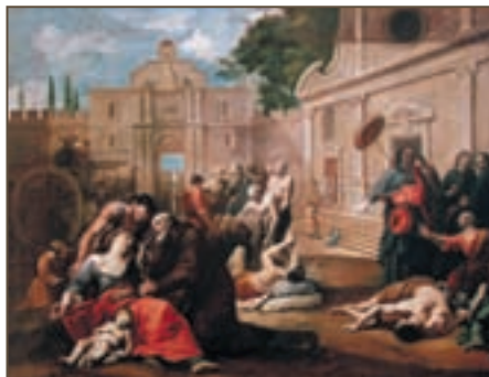
Репродукция. Итальянская школа живописи. Жертвы чумы

Вплоть до XIX века европейские медики не осознавали опасности заражения от прикосновения к трупам человека. Врач мог, обучая студентов, провести вскрытие трупа, а потом, не