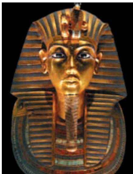
Золотая погребальная маска Тутанхамона

Об этой уникальной находке издано много прекрасных книг с фотографиями фантастических сокровищ гробницы, сняты художественные и документальные фильмы. А посетители Каирского музея могут посмотреть собственными глазами на несметные богатства, которые положили рядом с умершим Тутанхамоном его современники, веря, что все это ему обяза-