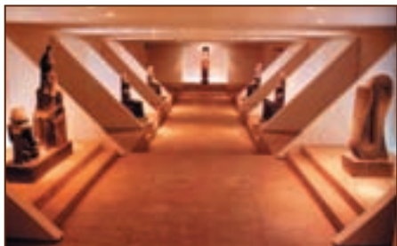
Галерея статуй, найденных под полом в храме Луксора

археологи нашли статую строителя храма Аменхотепа III, выполненную из розового кварцита, и еще пять статуй в натуральную величину, изображавшие того же Аменхотепа III и фараона Хоремхеба, преклонивших колени перед богинями Ахтор и Иунет.