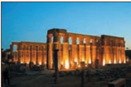
Храм богини Мут. Луксор

Если идти по аллее сфинксов в другую сторону, придешь к недавно открытому храму богини Мут – большому, но еще малоизученному археологами. Место раскопок указала статуя богини Секмет, выступавшая из песка. По мнению ученых, аллея сфинксов была построена по приказу Тутанхамона.