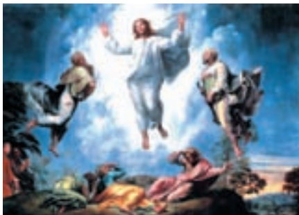
Репродукция. Рафаэль Санти. Преображение. Фрагмент. 1518–1520

Божественного призвания и вечной жизни в Царствии небесном. Поэтому именно он, Моисей, сошел с неба на гору Преображения, чтобы лично заверить учеников в том, что никакие жертвы не бессмысленны ради Христа. Явление Моисея Христу и ученикам – это ответ на то, что путь самоотречения – не бессмысленная жертва. Любые лишения ради Христа оборачиваются благословениями. Взять свой крест и следовать за Христом – единственно верный выбор.