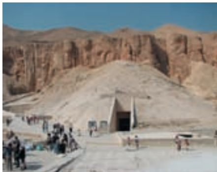
Прямо гробница Рамзеса VI, чуть правее перед ней гробница Тутанхамона

К заходу солнца следующего дня были расчищены еще 15 ступеней и каменная дверь с кладбищенской