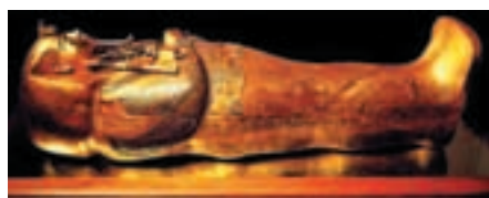
Третий, внутренний, саркофаг фараона Тутанхамона из золота

но было бы без труда вынести, они в спешке разбросали то, что им не было нужно.