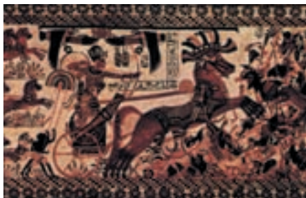
Тутанхамон на колеснице

Ученые до сих пор гадают, почему Тутанхамон, пользовавшийся всеми благами тогдашней цивилизации, умер так рано. Рентгеновское обследование мумии Тутанхамона, сделанное в конце 1960-х годов, показало, что на его черепе в районе левого уха имеется повреждение, которое могло быть результатом сильного удара. Предполагалось, что он мог получить ранение в сражении или при падении с колесницы. Эта версия возникла потому, что на одной из стенок сундука, в котором находились сокровища Тутанхамона, фараон изображен на боевой колеснице во время сражения.