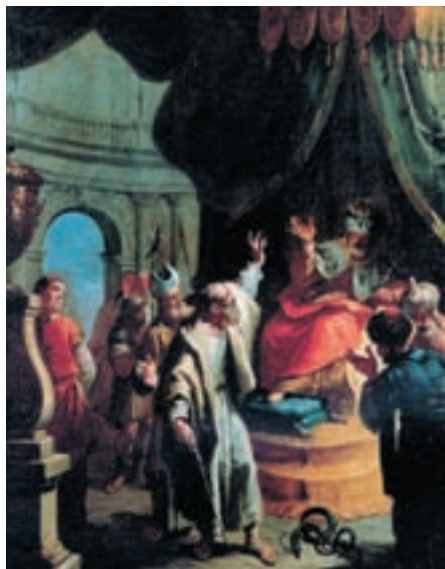
Репродукция. Франческо Фонтебассо. Моисей перед фараоном

Даже когда Господь призвал Моисея к служению и велел возвратиться в Египет, чтобы вывести народ израильский из рабства египетского, успех, казалось бы, не сопутствовал ему. Когда Моисей предстал пред фараоном с просьбой отпустить Израиль, фараон с презрением отказался. «Но фараон сказал: кто такой Господь, чтоб я послушался голоса Его и отпустил Израиля? я не знаю Господа и Израиля не отпущу» (Исх. 5:2). После этого правитель Египта сделал труд евреев еще более тяжелым. В ответ на бедствия, постигшие Египет по воле Бога, фараон ожесточил свое сердце и все равно отказался отпустить израильтян. И лишь когда в пасхальную ночь умер