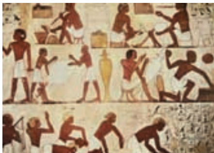
Фрагмент росписи гробницы Тутанхамона

По окончании погребального обряда, когда сокровища были размещены