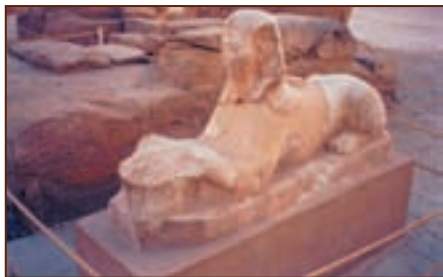
Сфинкс Тутанхамона. Луксор

ре, а сфинкс с лицом Тутанхамона обнаружен в 1989 году в одном из древних храмов Луксора.