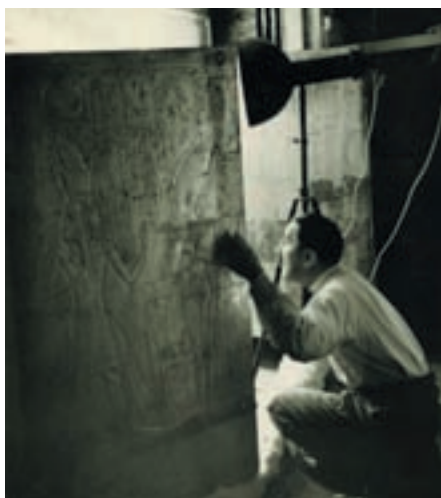
Говард Картер открывает наосы, окружающие саркофаг

Восемнадцатилетний фараон был похоронен с фантастической роско-