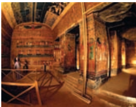
Погребальная камера гробницы Сети I

ский археолог Белзони Джованни Баттиста, проводивший поиски в Долине Царей. Одна из интереснейших гробниц Долины Царей, которую открыл Белзони, – гробница Сети I. Гробница имеет протяженность более 120 метров и уходит в глубь скалы. Она необыкновенно сложна по своей конструкции и имеет богатое убранство.