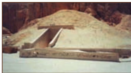
Гробница Тутанхамона в Долине Царей

Из-за внезапной смерти фараону не успели подготовить достойную гробницу, и поэтому Тутанхамон был