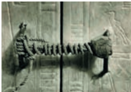
Нетронутая печать третьего наоса, окружавшего саркофаг. Грабители не покушались на покой фараона

Почти все пространство погребальной камеры занимал огромный, обитый листовым золотом ящик с двусторонней крышкой. В нем были вложенные один в другой несколько саркофагов. Во внутреннем, сделанном из чистого золота, весом более 100 кг, покоилась мумия Тутанхамона с золотой маской на лице, точно передающая облик молодого фараона. Мумия с головы до ног была осыпана драгоценностями – от простых золотых предметов до