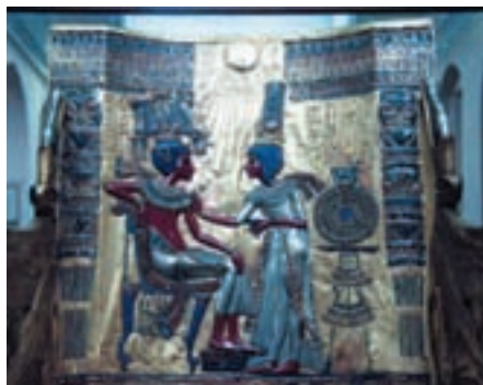
Спинка царского трона. Солнечный бог Атон благословляет юного фараона и его супругу

шью. В гробнице находились великолепные произведения искусства. Вместе с Тутанхамоном было захоронено свыше двух тысяч ценных предметов. Чтобы вынести все это наружу, потребовалось 7 недель. Было зафиксировано расположение предметов в гробнице, находки внесены в каталог, сделаны фотографии. Хрупкие предметы помещали в специальные контейнеры. Нить бисерного ожерелья разорвалась, но бусинки уложили в той последовательности, в которой они были найдены, чтобы впоследствии можно было снова собрать ожерелье. Странным было то, что предметы в прилегающей к погребальной камере комнате беспорядочно разбросаны. Это затрудняло осмотр и транспортировку. За исключением сокровищ, которые заботливо были уложены в погребальной камере, все другие предметы оказались хаотично разбросаны. Картер предположил, что расхитители пробрались в гробницу сразу после захоронения. Пытаясь найти мелкие вещи, которые мож-