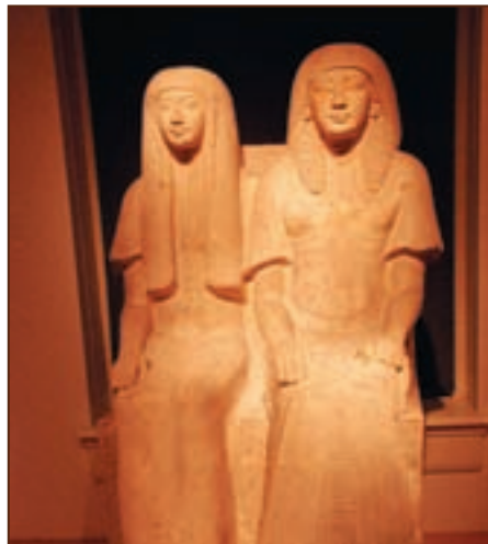
Статуя казначея Майя и его жены. Лейден

находятся в Музее этнологии в Лейдене (Нидерланды). К сожалению, археологи того времени больше интересовались поиском сокровищ, чем