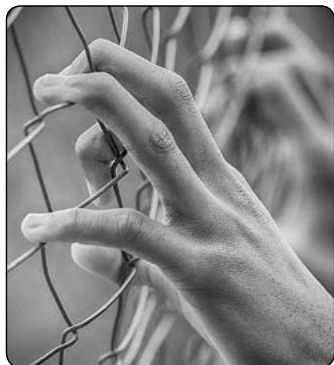
Елена*, 20 лет

(Попросите молодую женщину поделиться этим свидетельством от первого лица во время урока субботней школы.)