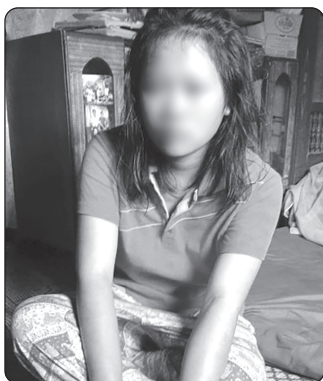
Кина*, 14 лет

ВСТУПЛЕНИЕ: Церковь адвентистов седьмого дня — это всемирная семья, объединившая людей из разных стран и народов, которые приняли Иисуса, верны Его заповедям и ожидают скорого Второго пришествия. Каждую субботу мы слышим вести из разных стран о том, как Бог меняет жизни людей. Это очень воодушевляет нас. Эти вести