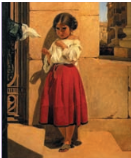
Репродукция. Е. С. Сорокин. Нищая девочка-испанка. 1852

Новый Завет, который хочет заключить с нами Господь, в действительности не заменяет собой Десяти Заповедей. Его смысл в том, что Господь наделяет нас силой исполнить заповеди. Об этом прекрасно сказано в Священном Писании: «Вот завет, который завещаю дому Израилеву после тех дней,