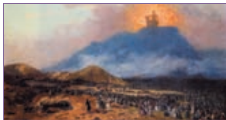
Репродукция. Жан Леон Жером. Моисей на горе Синай

вершин горного массива на юге Синайского полуострова Рас-Ес-Сафсафех, у подножия которого расстилается обширная равнина