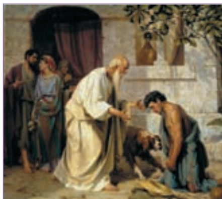
Репродукция. Н. Д. Лосев. Блудный сын. 1882

ших грехов. В послании к Евреям сказано, что Он «подобно нам, искушен во всем, кроме греха. Посему да приступаем с дерзновением к престолу благодати, чтобы получить милость и обрече-