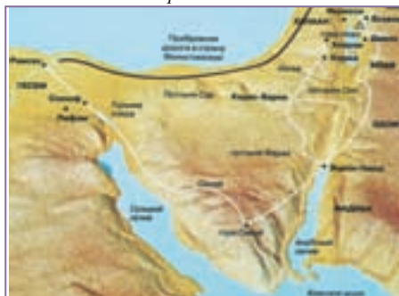
Место, где по христианской традиции находится гора Синай и признаваемый многими исследователями маршрут исхода израильтян