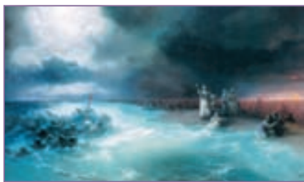
Репродукция. И. К. Айвазовский. Переход евреев через Черное море. 1891

море, и гнал Господь море сильным восточным ветром всю ночь и сделал море сушею, и расступились воды» (Исх. 14:21). Из безнадёжной, казалось бы, ситуации открылся выход. Археологи нашли обмелевший риф – подтверждение тому, что именно здесь Господь провел народ израильский, наведя сильный ветер, благодаря которому «расступились воды» моря. Израильтяне смогли по дну перейти на другой берег Красного моря, а когда египтяне устремились за ними, «вода возвратилась и покрыла колесницы и всадников всего войска фараонова, вошедших за ними в море» (Исх. 14:28).