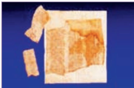
Фрагменты Синайского кодекса

одной из Книг Библии. Найденная кипа страниц содержала часть текста Септуагинты 1 . Ученый уговорил монахов отдать ему все 43 листа. Фон Тишендорф обнаружил, что в библиотеке имеются еще страницы со схожим текстом. Однако монахи на этот раз не пожелали отдать манускрипт графу. Вернувшись из поездки, фон Тишендорф передал пергаментные манускрипты своему покровителю, королю Саксонии Фридриху Августу.