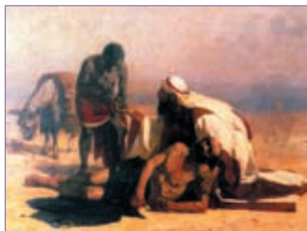
Репродукция. В. И. Суриков. Милосердный самаритянин. 1874 (См. Лк. 10:25—37)

В Законе Божьем отражена Божья любовь, Его воля и намерения в вопросах поведения человека и его взаимоотношений с Богом и ближними. Наш мир стал бы совершенно иным, если бы все в точности следовало его предписаниям. К сожалению, далеко не многие люди признают Божественный авторитет. Закон Божий с легкостью пренебрегается, люди больше поглощены собственными эгоистичными интересами и очень мало времени уделяют Богу и нуждающимся ближним.