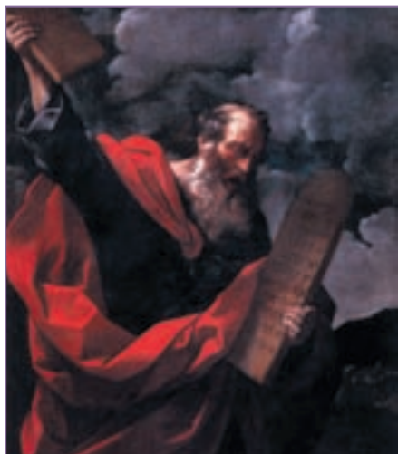
Репродукция. Гвидо Рени. Моисей со скрижалями. ок. 1624

Где бы ни располагалась гора Синай, важность этого места определяется тем, что именно там Господь Бог дал людям Десять Заповедей. Дарование Закона – одно из самых значимых и торжественных событий в Священной истории Израиля. Господь провозгласил Свои уставы двум миллионам человек и записал перстом Свое Слово на каменных скрижалях, которые вручил Моисею.