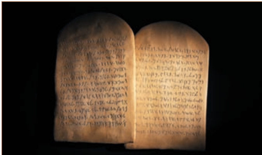
Десять заповедей на еврейском языке

Не делай себе кумира и никакого изображения того, что на небе вверху, и что на земле внизу, и что в воде ниже земли; не поклоняйся им и не служи им, ибо Я Господь, Бог твой, Бог ревнитель, наказывающий детей за