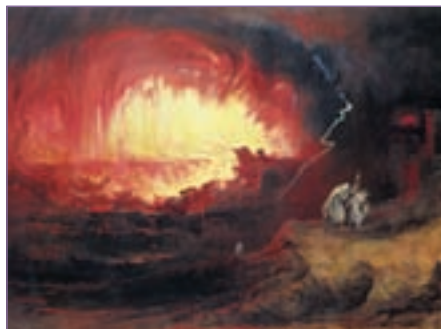
Репродукция. Джон Мартин. Гибель Содомы и Гоморры. 1852

Заповедь «не кради» также зачастую не выполняется. Стали обыденным явлением не только банальные кра-