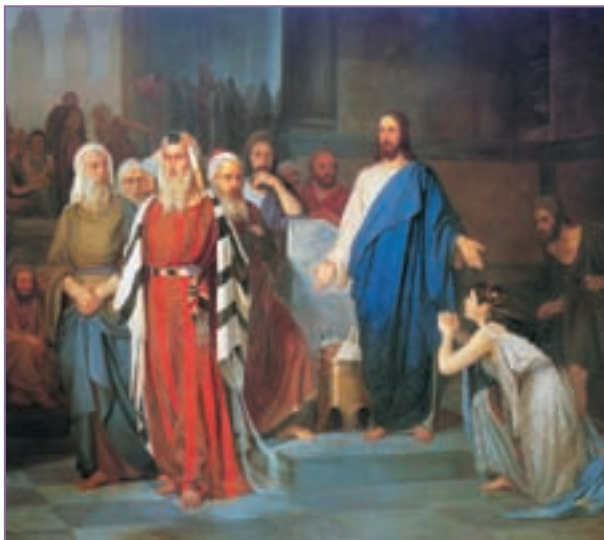
Репродукция. И. Л. Аскназий Блудница перед Христом. 1879

И вот еще одна цитата: «Нам еще не раз придется повергаться к ногам Иисуса и оплакивать свои промахи и ошибки. Но мы не должны падать духом. Даже если враг побеждает, мы не оставлены и не отвергнуты Богом. Нет, Христос на-