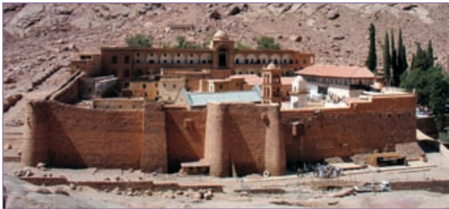
Монастырь у подножия горы

отождествляет гору, на которой Моисей получил каменные скрижали Завета, со второй по высоте вершиной (2300 м) этой цепи – горой Джебель Муса (по-арабски «гора Моисея»). У подножия самой высокой горы Синайского полуострова, Джебель Катарины (2642 м), построен Монастырь Святой Екатерины. Снизу трудно