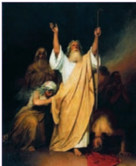
Репродукция. И. Н. Крамской. Молитва Моисея после перехода израильтян через Чермное море. 1861

В 10 километрах южнее современного города Суэц, у селения Адаби, Красное море сильно сужается. Его ширина в этом месте всего 7 ки-