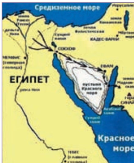
Возможный маршрут исхода израильтян и предполагаемое расположение горы Синай

Маршрут выхода евреев из Египта начинался в египетской земле Гесем и подробно описан в Книге Исход. Однако когда современные историки попытались реконструировать путь, по которому шли израильтяне, они столкнулись с проблемой идентификации упоминаемых в Библии мест. К сожалению, ни одно из географических названий на маршруте Египет – Ханаан, упомянутых в Библии, точно не установлено до настоящего времени. Ученые даже не пришли к единому мнению по поводу того, что это за Чермное