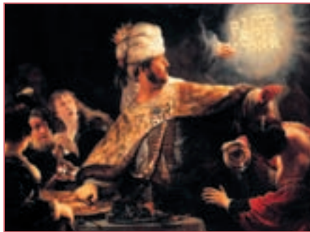
Репродукция. Рембрандт Харменс ван Рейн. Пир Валтасара. 1635

вавилонский царь Валтасар, ничуть не похожий на своего разумного деда Навуходоносора, чувствовал себя в безопасности. Валтасар был расточительным и беззаботным правителем. В ту ночь, когда войска Кира подступили к стенам города, он устроил грандиозный пир для своих приближенных, чтобы продемонстрировать, что никого не боится. Валтасар был абсолютно уверен, что мощная крепостная стена и река надежно защищают столицу. Пока приглашенные ели, пили и веселились, прославляя своих богов, царь Кир приказал отвести воды Ефрата в другое русло, а по осушенному старому руслу проник в город. Гости еще сидели за столами, когда в зал явился посланец и