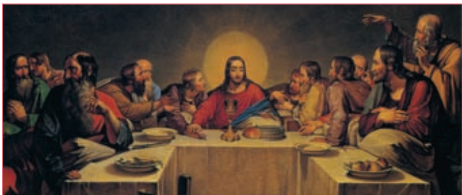
Репродукция. Василий Шебуев. Тайная вечеря. 1839

Никто не может отрицать тот факт, что римско-католическая церковь в течение многих столетий фанатично боролась с любым инакомыслием. Как это не удивительно, но на протяжении всей христианской эры за свои убеждения было замучено и предано