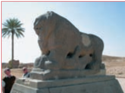
Древний каменный монумент, обнаруженный археологами во время раскопок на месте города Вавилона

добно облакам, и колесницы его как вихрь, кони его быстрее орлов» (Иер.4:7,13). Орлиные крылья символизируют стремительность, с которой это царство захватило весь цивилизованный мир.