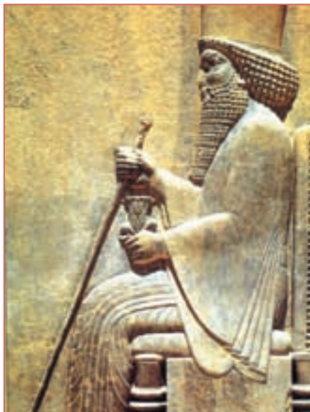
Рельеф персидского царя на стене дворца в Персеполе

были персидскими царями. Поэтому символический образ медведя, лапы которого длиннее с одной стороны, несомненно, подразумевает доминирующую роль персов в союзе двух народов, входивших в состав Мидо-Персидской империи. Персы, изначально бывшие вассалами мидян, затем стали господствовать над ними.