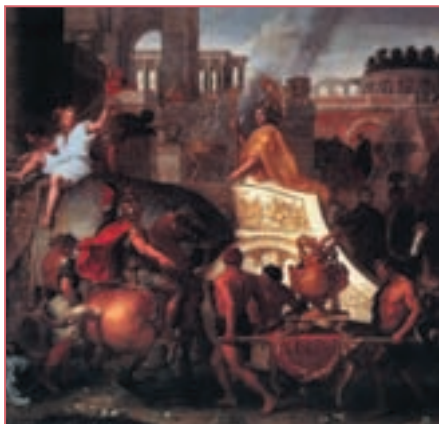
Репродукция. Шарль Лебрен. Александр вступает в Вавилон. Фрагмент, ок. 1664

Геллеспонт (Дарданеллы) по мосту и проведя флот мимо опасного места при мысе Афон по прорытому каналу, он направился в глубь Греции. По свидетельству греческого историка Геродота, Ксеркс располагал пятимиллионной армией, включая вспомогательные отряды и сопровождающие армию обозы с кухней, госпиталем и прочим персоналом. Подобно могучему медведю, мощная армия Ксеркса миновала Фермопилы и приблизилась к пределам Аттики, грабя и сжигая встречающиеся на пути города. Вскоре персы опустошили Аттику и сожгли Афины.