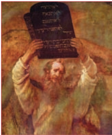
Репродукция. Рембрандт. Моисей со скрижалями законов. 1659

силе изменять существующие законы хоть каждый день. Но в данном случае, очевидно, упоминается какой-то другой закон. Как мы уже сказали, малый рог символизирует религиозную власть. Соответственно, здесь речь должна идти о законе Бога, а точнее, о Десятисловном законе, который Господь дал Моисею на горе Синай. Десять Заповедей являются основой всех государственных законов. Первые четыре заповеди Декалога показывают, как