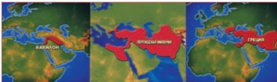
Территории мировых империй

Но и власть Александра Македонского не была бесконечной. Он внезапно умирает предположительно от малярии в возрасте 32 лет, в то время, когда весь цивилизованный мир лежал у его ног. После смерти великого полководца и императо-