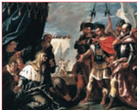
Репродукция. Гаспар Дизияни. Семья Дария перед Александром Великим. XVIII век

собрал свежие силы, чтобы снова сразиться с войском Александра. В большом сражении у города Исс Александр разбил наголову армию персидского царя Дария III, взяв в плен его мать, жену и детей. Перед