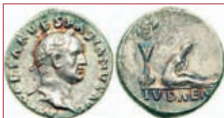
Древнеримский серебряный динарий в честь победы над Иудеей, чеканка 70 г. н.э. С лицевой стороны – голова императора Веспасиана. На обороте – плачущая Иудея сидит справа от трофеев