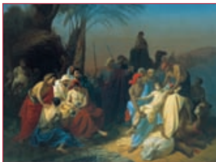
Репродукция. К. Д. Флавицкий. Дети Иакова продают своего брата Иосифа. 1855

В Бытие, первой книге Библии, повествуется, как патриарх Авраам, желая похоронить свою жену Сарру, приобрел за серебро пещеру Махпела. В этой же библейской книге упоминается еще об одной сделке. Сыновья патриарха Иакова продали своего родного брата мадиамским купцам: «И, когда проходили купцы Мадиамские, вытащили Иосифа изо рва и продали Иосифа Измаильтянам за двадцать сребренников; а они отвели Иосифа в Египет» (Быт. 37:28).