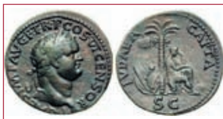
Римская медная монета асс, чеканка 78 г. н.э. На обороте – женщина под деревом с надписью по сторонам: Judaea capta (Плененная Иудея)

В древнем Израиле впервые чеканная монета появляется при Маккавеях. Именно Симон Маккавей получил в 140 г. до н.э. от сирийского царя Антиоха VII право чеканить монету, и от его времени до нас дошло много монет, которые можно увидеть в музеях. На лицевой стороне Маккавейских сиклей написано: «Сикль (или полусикль) Израильский»; а на обороте: «Иерусалим святой». При римлянах в Иудее также чеканились монеты, на которых с лицевой стороны выбивалось изображение того или иного римского императора, а на обороте — женщина под деревом с надписью по сторонам: Judaea capta (Плененная Иудея).