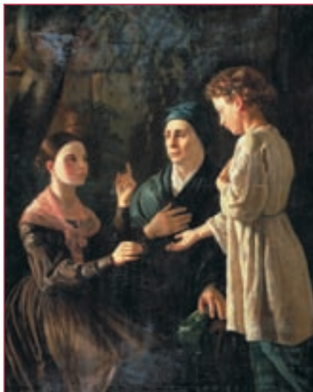
Репродукция. М. А. Мохов. Подача милостыни. 1842