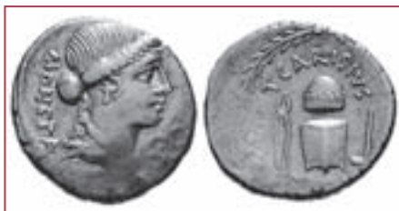
Динарий Тита Каризия с изображением Юноны-Монеты и инструментами монетной чеканки (46 г. до н. э.)

та. На лицевой стороне серебряной монеты римского магистрата Тита Каризия (45 г. до н. э.) изображена голова богини, а под ней написано слово «Монета» – одно из имен богини Юноны, что означало «предупредительница». В храме Юноны-Монеты располагался одно время монетный двор. В честь богини Юноны чеканные деньги и стали называться монетами.