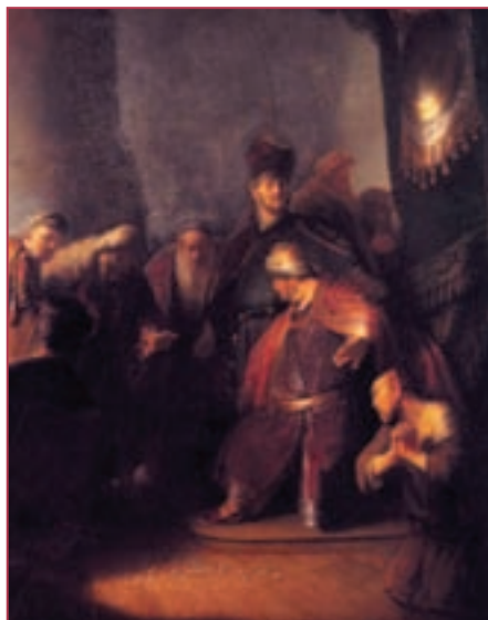
Репродукция. Рембрандт Харменс ван Рейн. Иуда, возвращающий серебрянники. Фрагмент. 1629

нет: одна монета иудейской чеканки, пять греческой и четыре римской.