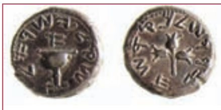
Израильский серебряный сикль первого года восстания, чеканка 66-73 гг. н.э., 13,38 грамм

При изготовлении монет в древности применялась чеканка. Штемпели изготавливались из закалённого металла с глубокой гравировкой негативного изображения. Раскалённый металл будущей монеты помещался между