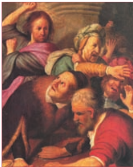
Репродукция. Рембрандт Харменс ван Рейн. Христос, изгоняющий менял из храма. 1626

На протяжении всей истории человечества деньги зачастую приобрета-