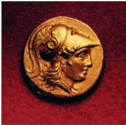
Греческая монета с изображением Александра Великого

Путешественники и торговцы, переезжая из одной страны в другую, вынуждены были обменивать свои деньги на местную валюту. В новозаветную эпоху в Израиле, как уже упоминалось