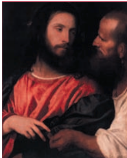
Репродукция. Тициан. Динарий Кесаря. Около 1515

и надпись?» (Мф. 22:20). На одной стороне серебряного римского динария было написано «Цезарь Тиберий», а на другой стороне отчеканен портрет цезаря. Иисус сказал: «Итак, отдавайте кесарево кесарю, а Божие Богу» (Мф. 22:21). Фарисеям в очередной раз не удалось скомпрометировать Иисуса и загнать Его в угол. Если бы Иисус сказал, что иудеям следует платить подать, фарисеи обвинили бы Его в отсутствии патриотизма и поддержке ненавистного им оккупационного режима. Но если бы Иисус посоветовал не платить подать, его обвинили бы в нелояльности римским властям и уклонении от уплаты налогов, что могло спровоцировать репрессии. Мудрый ответ Христа лишил их обвинение смысла.